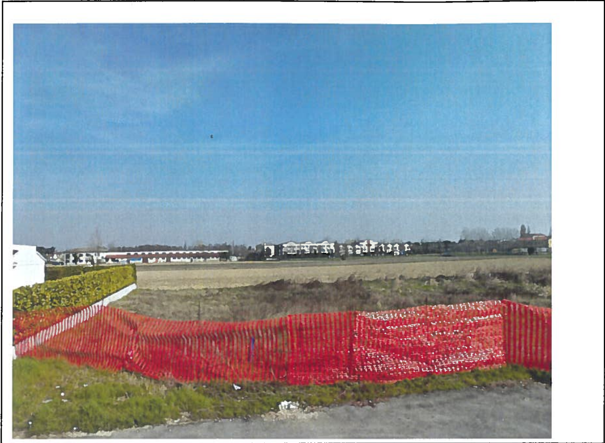
LOTTO 24 - vista Ovest