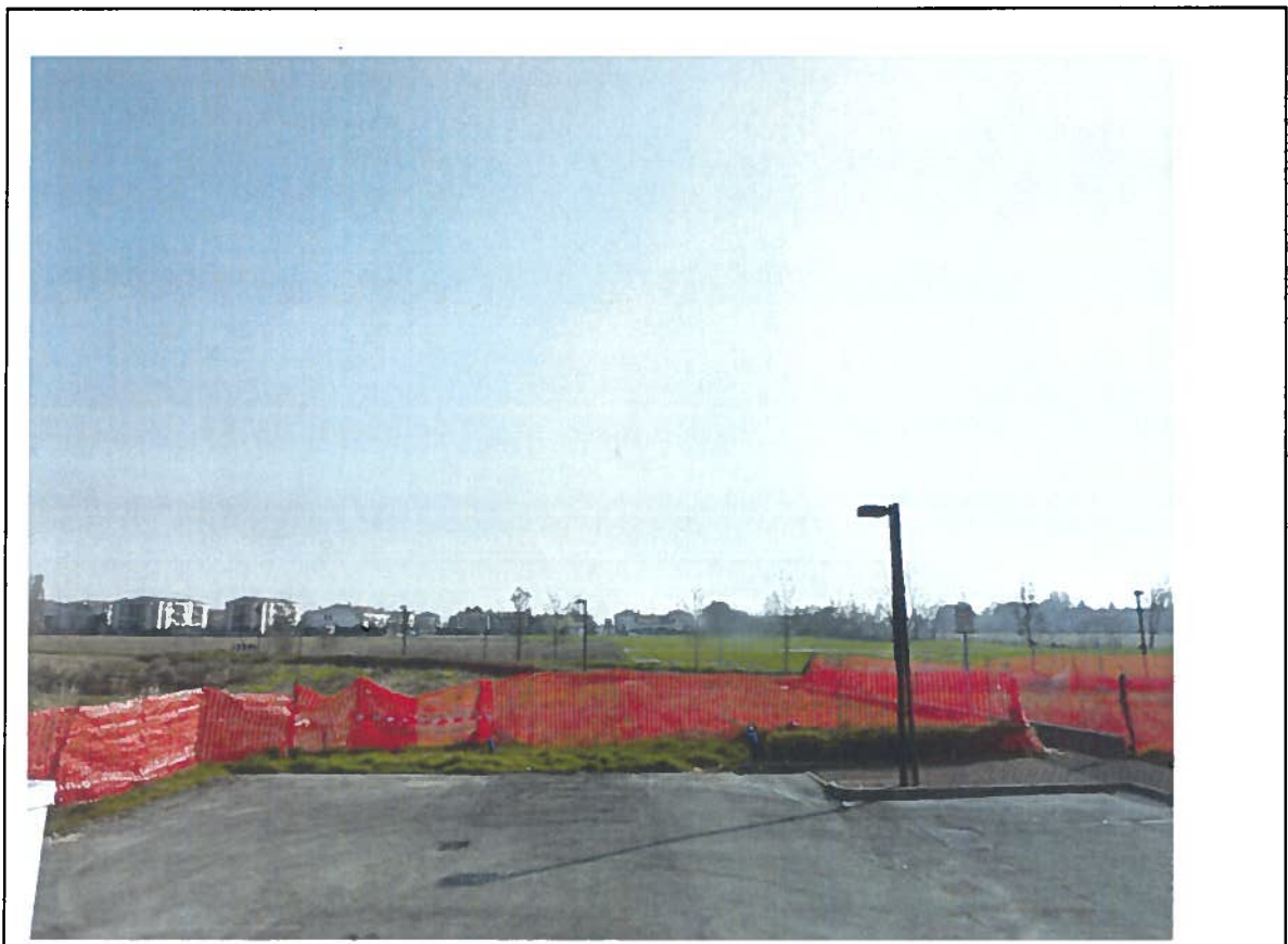
LOTTO 24 - vista Nord