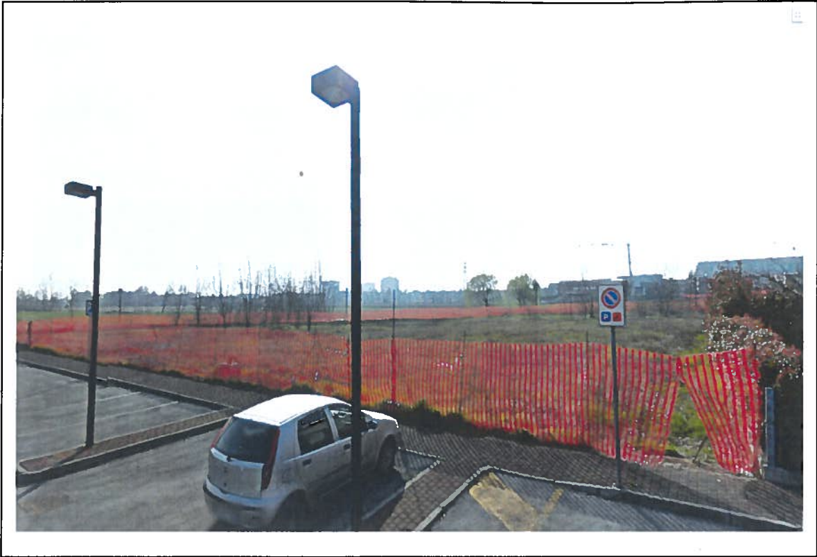
LOTTO 23 - vista Nord-Est