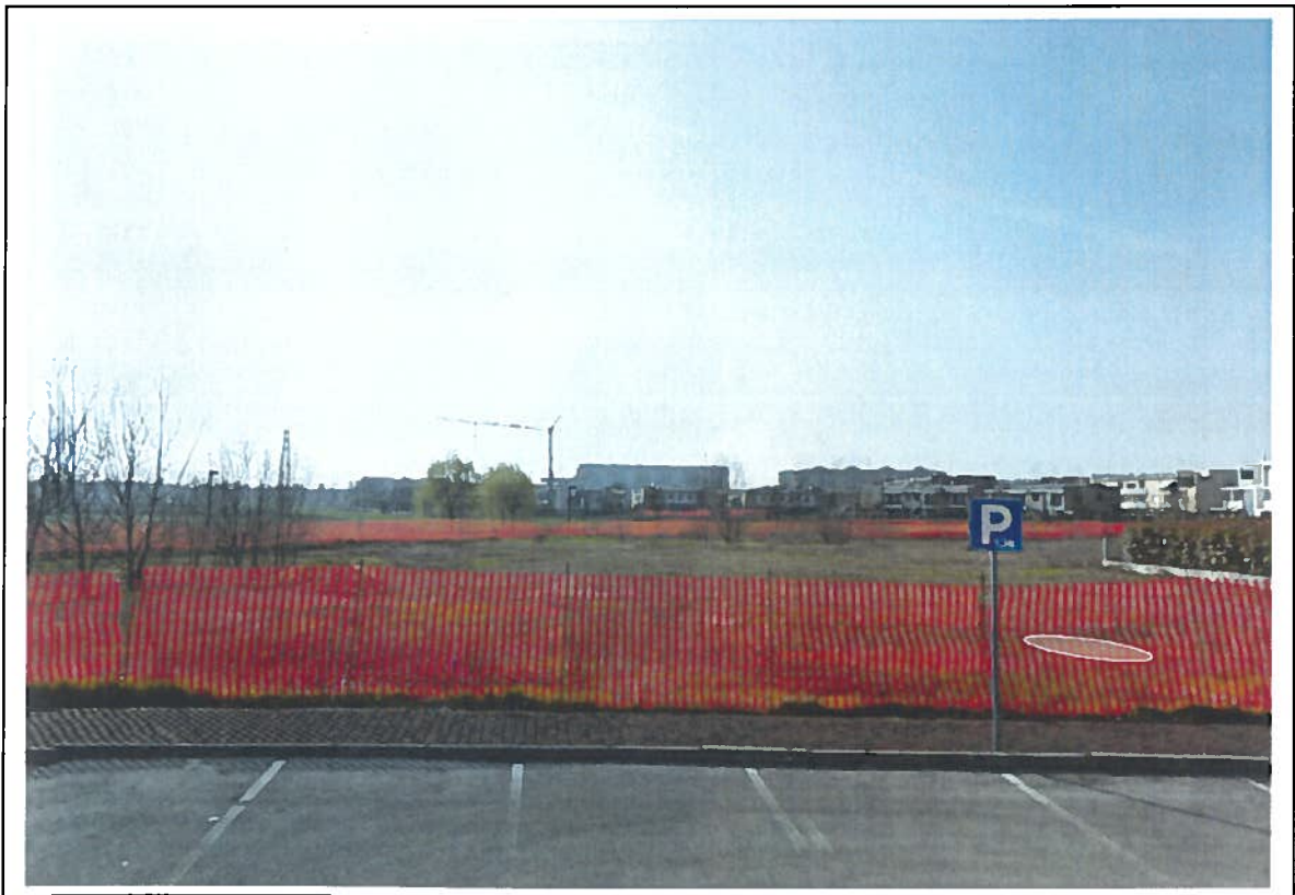
LOTTO 23 - vista Est